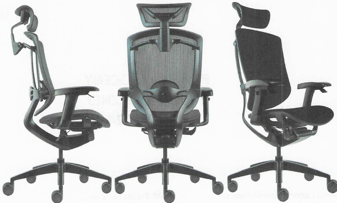
Fotel biurowy obrotowy MAVEN

Fotele obrotowe serii MAVEN to fotele na amortyzatorze gazowym z oparciem połączonym z siedziskiem przy wykorzystaniu mechanizmu synchronicznego - SYNCHRO G2S, które w połączeniu z możliwością regulacji wysokości siedziska i oparcia oraz kąta nachylenia oparcia, a także odpowiednimi profilami siedziska i oparcia zapewniają możliwość dostosowania warunków siedzenia do anatomicznych potrzeb użytkowników. Zastosowany mechanizm umożliwia siedzenie dynamiczne i przyjmowanie zrelaksowanej, odchylonej do tyłu pozycji ciała oraz właściwego fizjologicznie podparcia pleców, a zwłaszcza odcinka lędźwiowego kręgosłupa – niezbędnego podczas siedzenia dynamicznego.